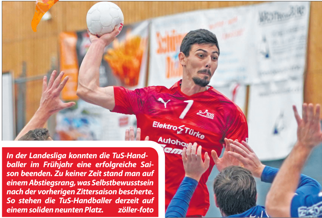
In der Landesliga konnten die TuS-Handballer im Frühjahr eine erfolgreiche Saison beenden. Zu keiner Zeit stand man auf einem Abstiegsrang, was Selbstbewusstsein nach der vorherigen Zittersaison bescherte. So stehen die TuS-Handballer derzeit auf einem soliden neunten Platz.