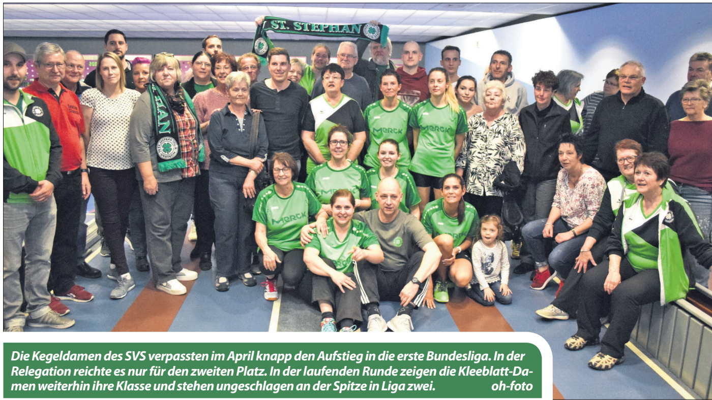
Die Kegeldamen des SVS verpassten im April knapp den Aufstieg in die erste Bundesliga. In der Relegation reichte es nur für den zweiten Platz. In der laufenden Runde zeigen die Kleeblatt-Damen weiterhin ihre Klasse und stehen ungeschlagen an der Spitze in Liga zwei.