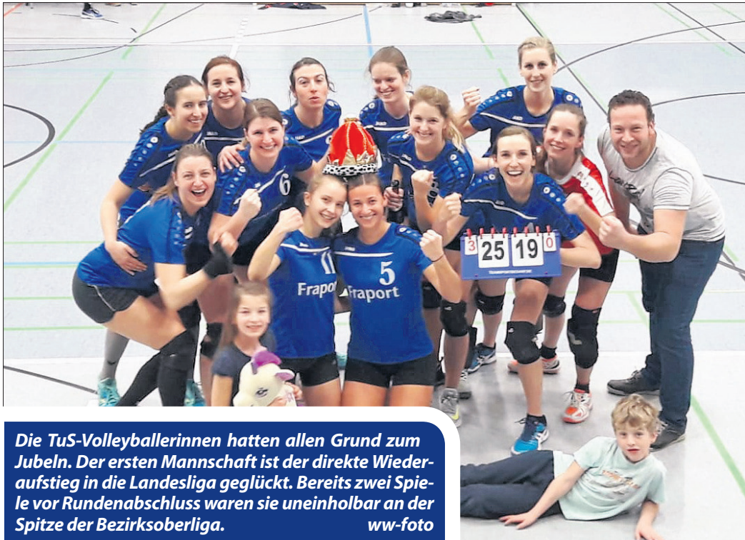
Die TuS-Volleyballerinnen hatten allen Grund zum Jubeln. Der ersten Mannschaft ist der direkte Wiederaufstieg in die Landesliga geglückt. Bereits zwei Spiele vor Rundenabschluss waren sie uneinholbar an der Spitze der Bezirksoberliga.