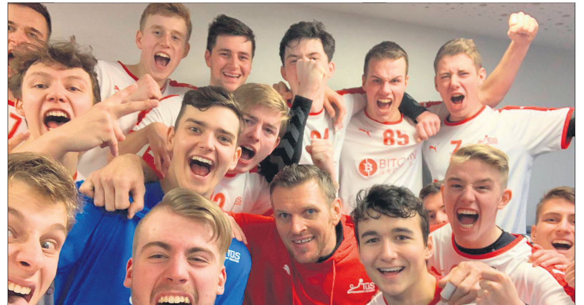
Die A-Jugend der TuS-Handballer bestritt eine starke Oberliga-Saison, die sie Ende März auf Rang fünf beenden konnte.